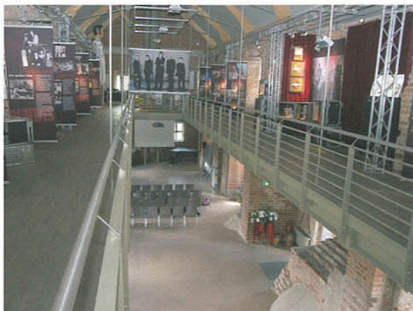
Die Eingang zum Burgcafé auf Burg Storkow befindet sich unmittelbar neben dem Tourismusbüro (Bild l.). Für den großen Festsaal (Bild r., unten) planen Olaf Schüren und seine Mannschaft regelmäßig gastronomische Veranstaltungen.

schule zur staatlich geprüften Betriebswirtin im Hotel- und Gaststättengewerbe qualifiziert und die Ausbildungseignerprüfung bestanden. Jetzt will sie für die Gastronomiesparte der Bäckerei eine Marketingstrategie erarbeiten, um eine größere Kontinuität der Angebote zu sichern. Angedacht sind z. B. neue Backkreationen für das Burgcafé als besondere Mitbringsel aus der Storchenstadt Storkow. Auch zusätzliche Veranstaltungen wie ein Rittermahl oder die Beteiligung an der 2. Storkower Kneipennacht Mitte Oktober sind geplant. „Mit diesen Leckerbissen im wahrsten Sinne des Wortes wollen wir mehr Gäste auf die Burg Storkow und in den Saal locken und so auch auf die Backwaren der Bäckerei Schüren aufmerksam machen“, erklärt sie. Erste Ansätze dazu gab es bereits mit Spargelangeboten im Mai/Juni sowie mit frischen Matjes und jungen Schollen im Juni/Juli. Seit August gibt es „Pffiffiges vom Pffiffer-