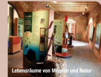
Lebensräume von Mensch und Natur

Im Dachgeschoss zeigen kleine, mit Liebe zum Detail gestaltete Modelle die Besiedlungsgeschichte der Landschaft, zunächst durch die Germanen, später dann durch die Slawen. Hörstationen bieten auf Knopfdruck vertiefende Informationen. Die Besucher erfahren, welche Rolle Jaxa von Köpenick und Albrecht der Bär gespielt haben und wie sich in dieser Zeit die