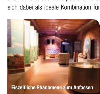
Eiszeitliche Phänomene zum Anfassen

Die Burg Storkow ist eine der ältesten Burgen in Brandenburg. Es gibt wohl kaum einen besseren Ort, um die Besucher der Region rund um die Groß-Schauener Seen und den Naturpark Dahme-Heideseen mit der Natur- und Kulturgeschichte bekannt zu machen. Auf drei Etagen bietet das Natureum in einer Dauerausstellung erlebnisreiche Einblicke in die Geschichte und stellt die faszinierenden Schätze der Natur vor, die an und in den Seen, in den Wäldern und auf den Binnendünen leben. Die Verbindung von Natureum und Besucherzentrum des Naturparks erweist sich dabei als ideale Kombination für