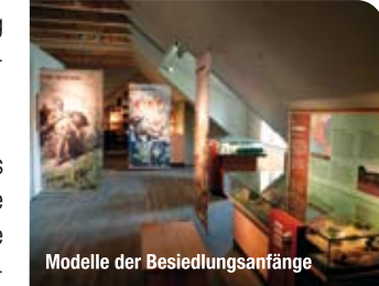
Modelle der Besiedlungsanfänge

Als Abschluss des Rundgangs oder auch als Auftakt zum Ausstellungsbesuch bietet eine Multivisionsschau einen lebendigen Überblick über die Geschichte und die heutigen Angebote rund um die Burg Storkow.