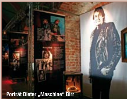
Porträt Dieter „Maschine“ Birr

Zu bestaunen sind der Staatspreis der DDR, der Goethepreis und die vielen Interpretenpreise, die die PUHDYS in den 70er-Jahren fast jährlich abgeräumt haben, und nicht zuletzt auch exemplarisch zwei der 15 Goldenen Schallplatten.