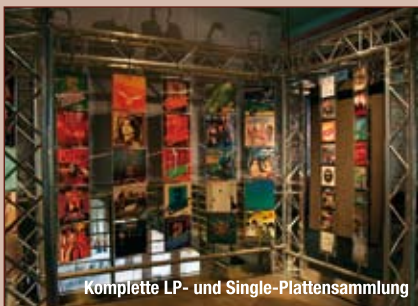
Komplette LP- und Single-Plattensammlung

Für die Ausstellung haben die Bandmitglieder Raritäten und Kurioses aus 40 Jahren Bandgeschichte zusammengetragen: seltene Poster aus den 70er- und 80er-Jahren, Reiseandenken und Pässe voller Stempel von den großen Osttourneen in den 70ern.